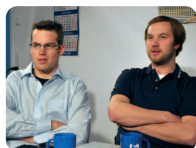
Probesitzen für die richtige Ausleuchtung