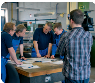
Bei den Dreharbeiten

Bewegte Bilder gewinnen immer mehr an Bedeutung, denn mit ihnen kann man sich schnell und gleichzeitig unterhaltsam informieren. Viele schauen sich gar nicht erst die Website der Unternehmen an und suchen gleich nach Videos auf YouTube.