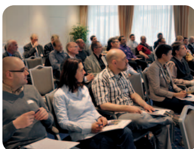
Die Veranstaltung im April war sehr gut besucht

Es betrifft jeden einzelnen Betrieb – Unternehmer und Führungskräfte haben für ein sicheres Arbeitsumfeld zu sorgen und Fehlverhalten und Fehlfunktionen möglichst auszuschließen. Davon abhängig sind nicht nur die Gesundheit und Unversehrtheit der Mitarbeiter, sondern auch die Funktionstüchtigkeit von