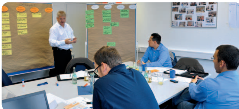
Bei so spannenden Themen hören alle aufmerksam zu

wird das eigene Stärkenprofil ermittelt und Themen wie Stressmanagement und wirkungsvolles Delegieren bearbeitet. Im Rahmen des Projektmanagements lernen die Teilnehmer alles über das Strukturieren von Projekten, wie man Projekte erfolgreich macht oder wie man mit