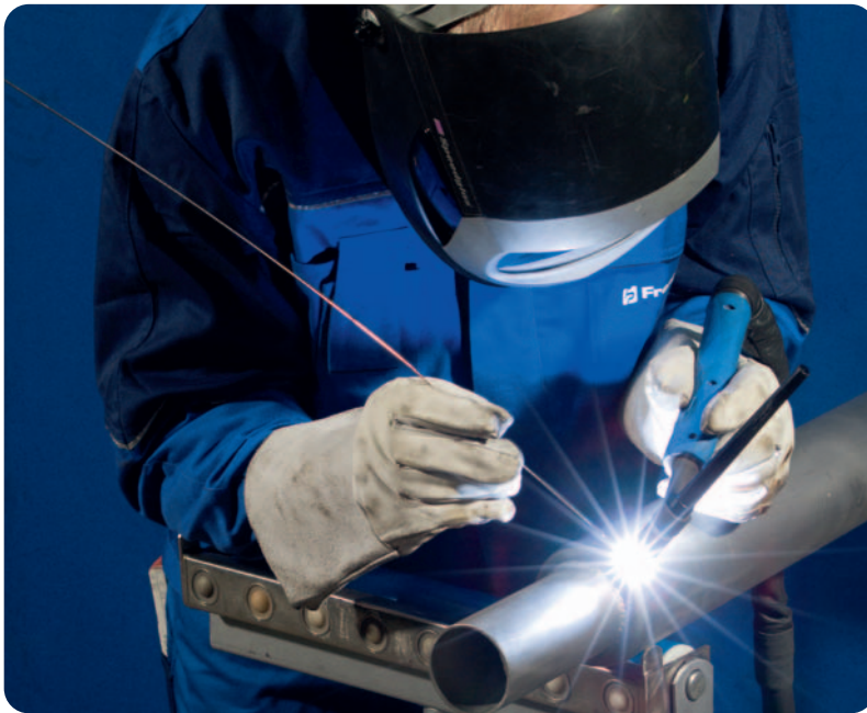
Die richtige Sicherheitsausrüstung schützt die Mitarbeiter

Sicherheit am Arbeitsplatz ist nicht nur eine zu erfüllende Vorschrift und Pflicht jedes Arbeitgebers, sie reduziert Unfälle und Ausfallkosten, motiviert Mitarbeiter, erhöht Produktivität, Wettbewerbsfähigkeit und Image des Unternehmens.