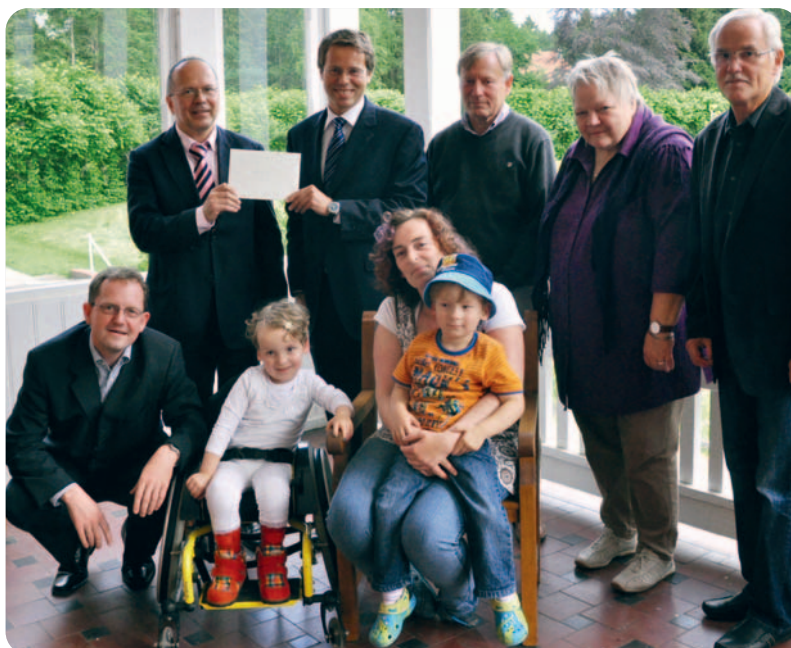
Scheckübergabe Ende Juni in der Helios Klinik