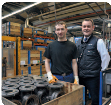
Hier bearbeitet einer unserer Mitarbeiter Pumpengehäuse

Mit einem Marktanteil von 50% bei den Heizungspumpen ist Grundfos weltweit unangefochtener Marktführer. In 80 Gesellschaften in 40 Ländern arbeiten heute 17.000 Mitarbeiter.