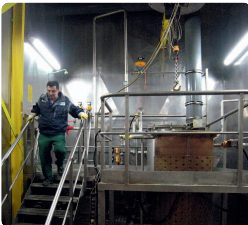
Prozesstank einer Bänderwaschanlage