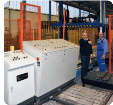
An einer Palettierpresse

Seitens Delkeskamp ist man mit der Planung und Durchführung höchst zufrieden. Man merke eben,