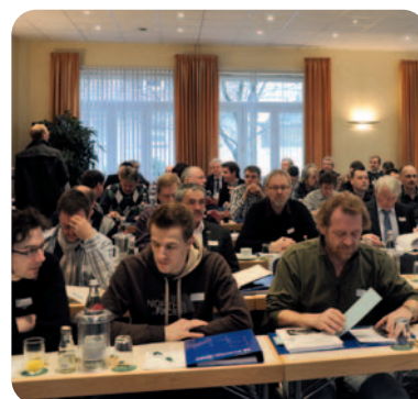
Ein voll besetzter Seminarraum