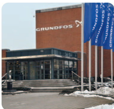
Die Grundfos-Hauptverwaltung in Wahlstedt

Gestartet mit Heizungs- und Unterwasserpumpen, bietet Grundfos seinen Kunden heute Systemlösungen für alle Gewerke der Gebäudetechnik und unterstützt unterschiedlichste Prozesse in der Industrietechnik. Hinzu kommen Angebote für kommunale Wasserversorger und Abwasserentsorger. Nicht zuletzt sind die Service-Dienstleistungen richtungsweisend in der Branche.