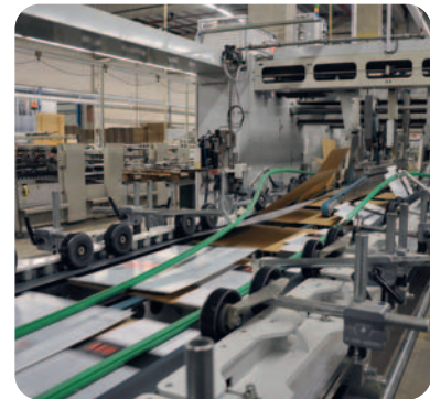
Eine der Faltschachtelklebemaschinen

dass besonders das Montageteam engagiert und flexibel zusammen arbeite und große Erfahrung habe. Und je nach Stand des Projektes waren ausreichend Fachkräfte vor Ort, um einen reibungslosen Ablauf und die Einhaltung der Terminpläne zu gewährleisten.